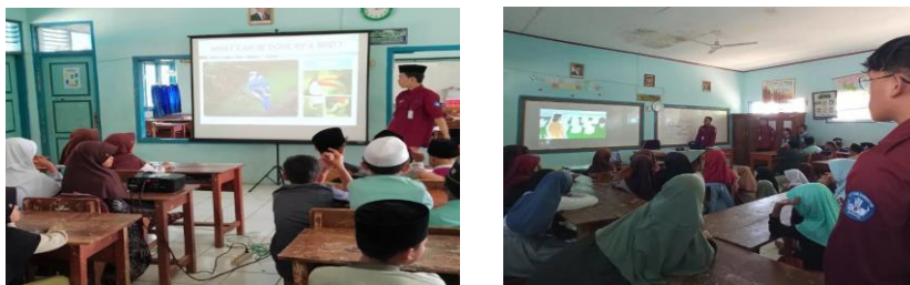
Gambar 4 & 5. Contoh Program Integrasi