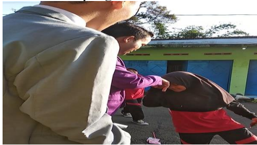
Gambar 6. Contoh Program Imitasi

baik. Sebaliknya, ketika mereka meniru teladan yang buruk, maka mereka juga akan memiliki karakter yang buruk. 35