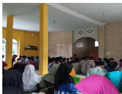
Gambar 3 & 4. Contoh Program Kegiatan Pembiasaan